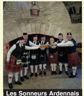
Les Sonneurs Ardennais