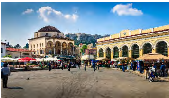
(Barrio de Monastiraki)