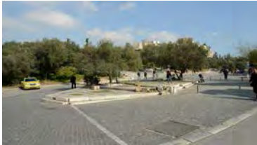
(The Dionysios Areopagitis street)

Vendredi 19 octobre 2018: Visite du site archeologique de l' Acropole et du Musée de l' Acropole, Exposition dans l' Edifice Zappeion, Conférence de Presse Officielle au Zappeion, Assemblée Generale du CEUCO au Club des Officiers des Forces Armées