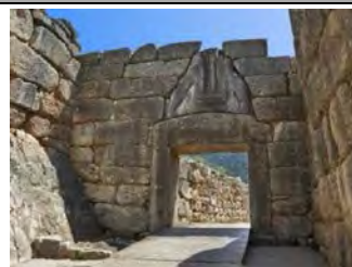
(Archaeological site of Mycenae)

08: 00 Départ d'Athènes à l'ancienne Olympie (à 291 km d'Athènes) • Départ de l'ancienne Olympie à Nemea (visite des caves) (ancienne Olympie à Nemea 184 km). (Si nous pouvons partir plus tôt nous visiterons Micenes). Déjeuner. Prix de l'excursion avec déjeuner et transport inclus : 90 €