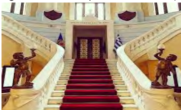
(Club de Oficiales de Fuerzas Armadas)

10:00 a.m. Rassemblement de toute la Délégation des participants dans la rue piétonne Dionysios Areopagitis, ou face au Théâtre Herodes Atticus.