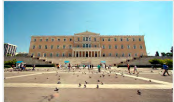
(Plaza de Syntagma )