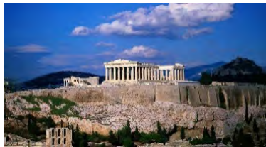
(Lugar arqueológico de la Acropolis - Partenón)