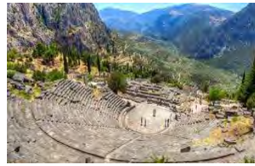
(Archaeological site of Delphi)