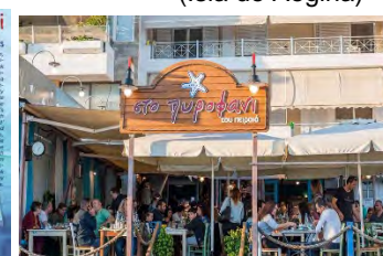
(Restaurant «To Pyrofani tou Peiraia»)

. 09:00 a.m. Départ pour la croisière d'un jour vers les Îles du Golfe Saronique (en dessous de la région d' Attique). Déjeuner à bord du bateau de croisière ou dans une des îles. Participation avec déjeuner : 85 € 19:00 Dîner dans le restaurant « A Pyrofani tou Peiraia » 25 € (à 13 km du centre de la ville - Au Pirée)