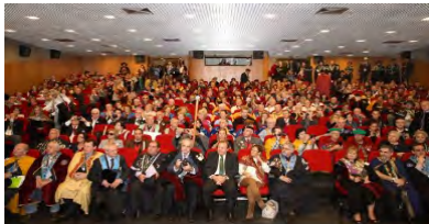
(Sala de Congresos)