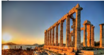
(Templo antiguo de Poseidón – Cabo Sounion)