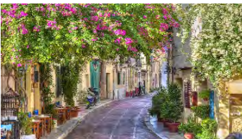
(Barrio de Plaka)