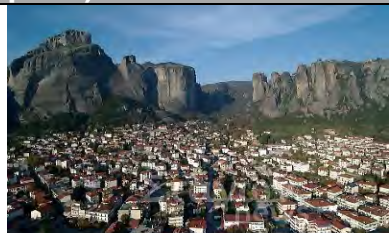
( Kalambaka City)