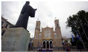
(Catedral principal de Atenas)

Dimanche 21 octobre 2018- Visite de la Cathedrale Principale d' Athenes. Messe. Promenade dans les rues d'Athènes, Défilé des membres du CEUCO, Relève de la Garde devant la tombe du soldat inconnu, Visite des Stands de l' Exposition au Zappeion, Visite du Temple Antique de Poseidon au cap Sounion.