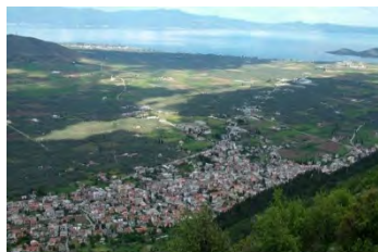
( Atalanti City )

09:00 Départ d' Athènes vers le site archéologique de Delphes (à 181 km d'Athènes) •Départ de Delphes vers Atalanti et visite des caves et des brasseries. Déjeuner. (Delphes à Atalanti 72.5 km) Prix de l'excursion avec déjeuner et transport inclus : 75 €