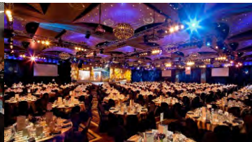
(Cena de Gala)

09:00 a.m. Arrivée des congressistes au bâtiment Zappeion 10:00 a.m. Ouverture du Congrès 13:00 - 17:00 Gastronomie européenne, internationale et grecque. autour des stands 21:00 . Dîner de Gala