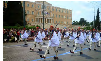
(Cambio de la Guardia -