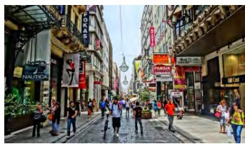
(Calle de Ermou)