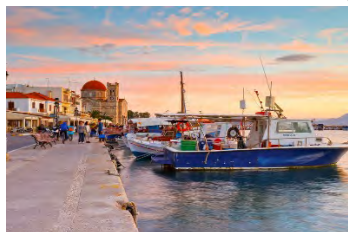
(Isla de Aegina)